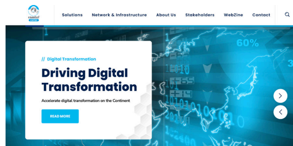
Capture de présentation de quelques services.