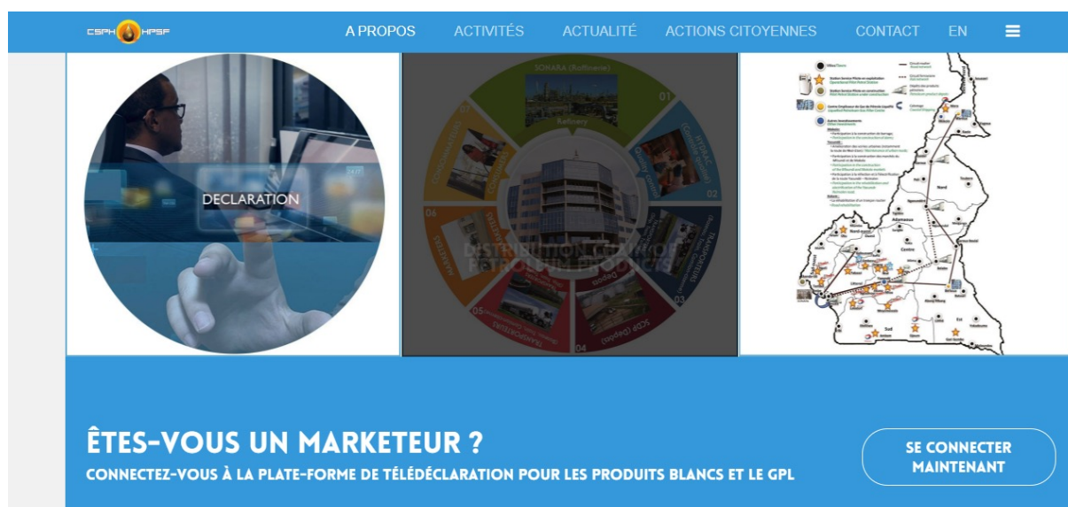
Capture d'écran du lien de la plateforme de télédéclaration

Bien que le site web ne permette pas encore de soumettre des réponses aux appels d'offres via un processus entièrement digitalisé, il convient de noter que la CSPH a déjà entrepris des initiatives significatives en matière de transformation numérique. En effet, la mise en place de la télédéclaration pour les produits blancs et le GPL illustre clairement sa volonté de digitaliser progressivement l'ensemble de ses procédures. Cette démarche traduit un engagement manifeste en faveur de l'optimisation des processus administratifs et de la modernisation des pratiques internes.