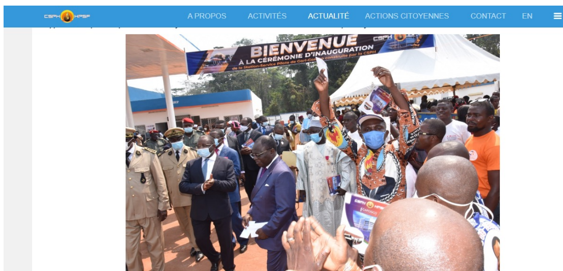
Capture d'écran de l'inauguration de la stations-service pilotes de GARI GOMBO dans la Région de l'Est

À cet effet la CSPH traduit de manière appréciable ses missions en actions concrètes au service des usagers. Parmi ses réalisations, on note la construction du Centre Emplisseur de gaz à Maroua, ainsi que la création de stations-services pilotes en partenariat avec les marketeurs dans des zones éloignées et non rentables. Elle a également entrepris la réhabilitation d'un tronçon routier de 256 mètres linéaires à Kékem, suite à un glissement de terrain ayant entraîné le détournement de l'itinéraire d'approvisionnement vers le dépôt de Bafoussam via Yaoundé. En outre, la CSPH met à disposition de manière continue des documents détaillant la structuration des prix des produits pétroliers blancs.