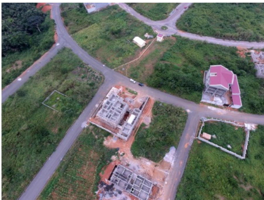
Capture d'écran des lotissements dans la zone NKOLNGUET COMMUNITY LANDS

La MAETUR s'illustre pleinement dans sa mission en traduisant ses missions en actions concrètes au service de ses divers usagers. Parmi celles-ci figurent les campagnes de commercialisation de lotissements, à l'instar de celle du lotissement de Nkolnguet Community Lands, où une réduction de 15 % était accordée. Elle assure également un accompagnement rigoureux des usagers dans les procédures d'immatriculation de leurs terrains, garantissant un suivi minutieux de leurs dossiers et la conformité légale de leurs biens. La MAETUR dispose d'une base de données étendue regroupant des terrains prêts à être commercialisés, incluant des lotissements tels que MAETUR OLEMBÉ, MAETUR OKOLO, et NGOULMEKONG. Par ailleurs, elle participe activement à des partenariats stratégiques, comme celui signé avec la commune d'arrondissement de Douala 3ème pour la restructuration et la rénovation d'une zone de 77 hectares située dans les quartiers de Bobongo et Cité Berge. Enfin, la MAETUR se distingue également par ses expertises en études d'aménagement, d'urbanisme, de voirie et réseaux divers (VRD), ainsi que dans l'analyse socioéconomique au profit de tiers, consolidant ainsi son rôle de leader dans le domaine de l'urbanisme et du développement territorial.